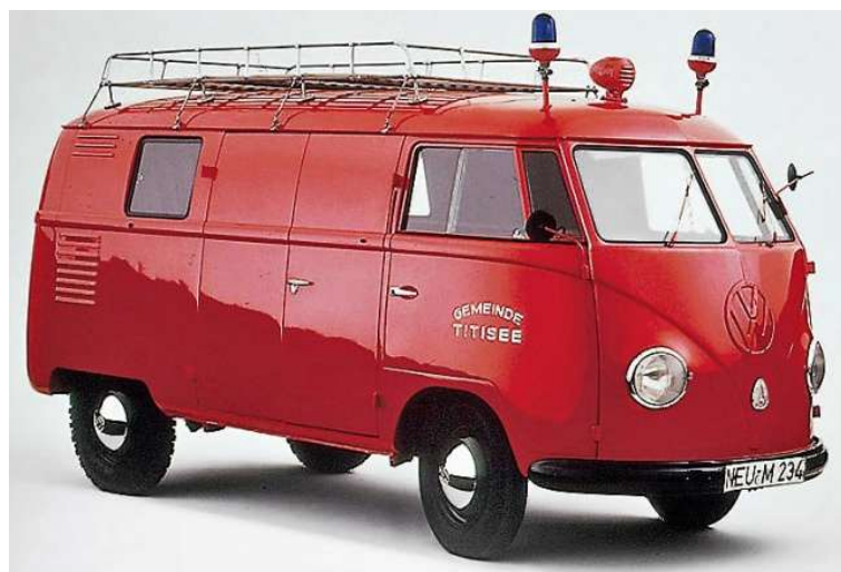
Symbolfoto des VW Bus

Als Ersatz für den Jeep wurde von Herrn Koloman Fazekas ein gebrauchter Bus Type „VW 2-21“ Baujahr 1955 um 7.000.- Schilling angeschafft.