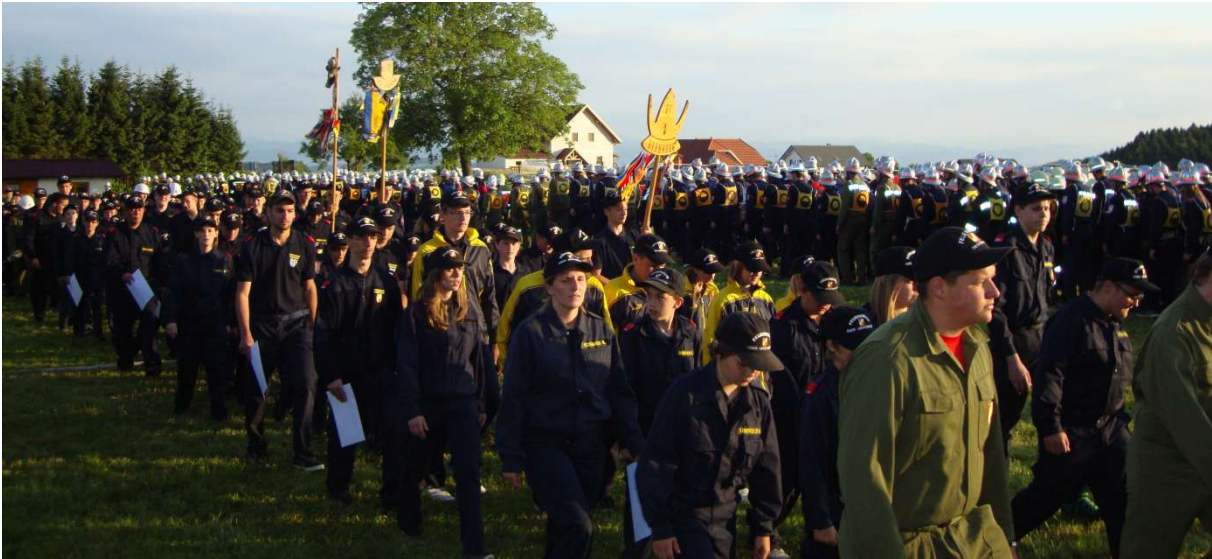
Ehrengäste, Pokale und Bewebsgruppen bei der Siegerehrung.