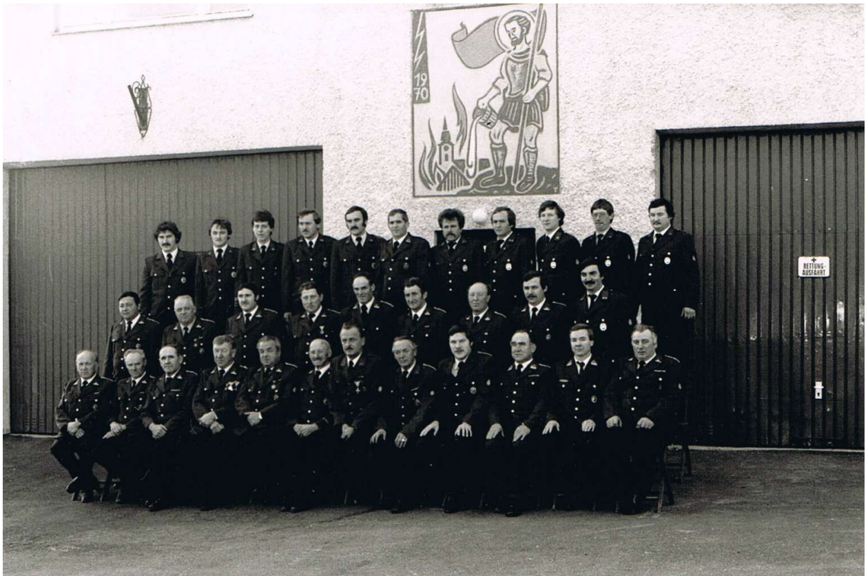
Ansicht Feuerwehrhaus mit Mannschaft im Jahre 1985

In den Jahren 1969 - 1970 wurde ein neues Feuerwehrhaus und eine Garage für das Rettungsauto an der nördlichen Ortseinfahrt gemeinsam mit dem Roten Kreuz errichtet. Dieses wurde am 16. August 1970 in feierlicher Form und in Anwesenheit zahlreicher Ehrengäste und Abordnungen der Freiwilligen Feuerwehren und der Rettungsstellen der Umgebung gesegnet.