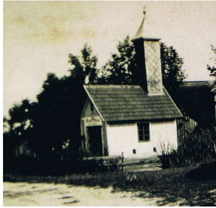
Feuerwehrhaus der Filiale Fünfling in den 20er Jahren