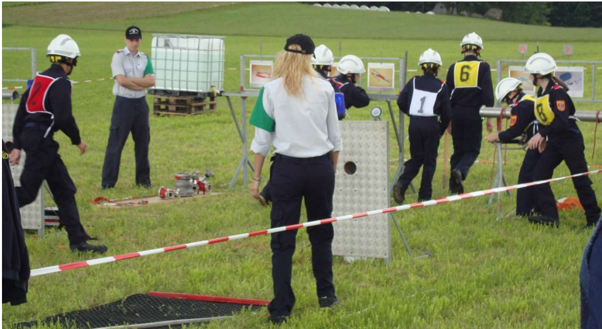
Die Bewerbsbahn der Jugend