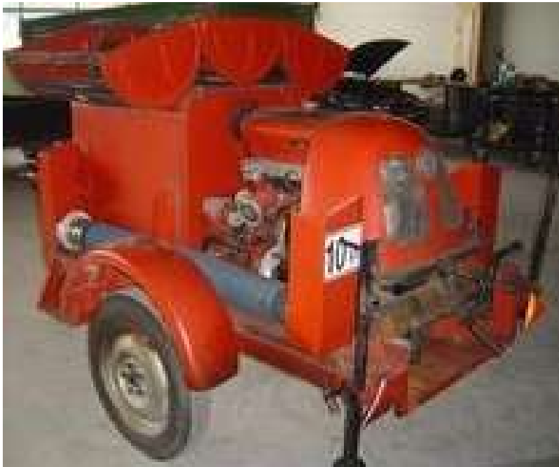
Sympolfoto des Anhängers

Von der Feuerwehr Papneukierchen in OÖ wurde ein Einachsanhänger angekauft.