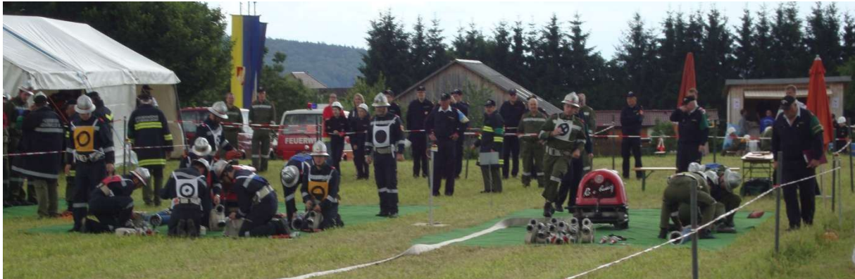
Die Bewerbsbahn der Aktiven Mannschaft

Der Bezirksleistungsbewerb und der Bezirksjugendleistungsbewerb wurden am 21. Juni 2014 abgehalten.